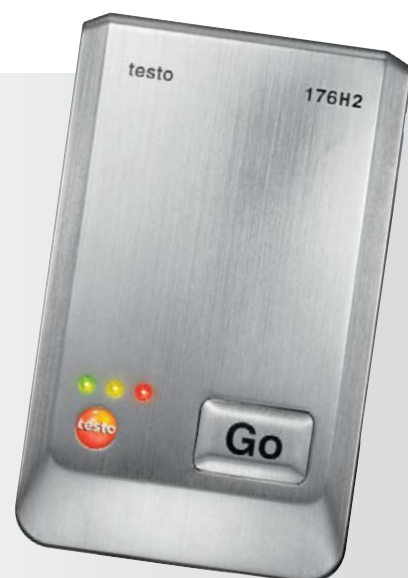
Estrutura de menu com 1 botão