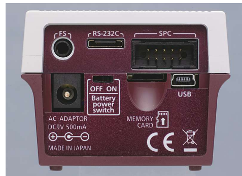
Múltiplas saídas RS-232C, USB e cartão microSD