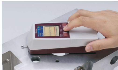
Exemplo de aplicação do aparelho sobre superfície plana