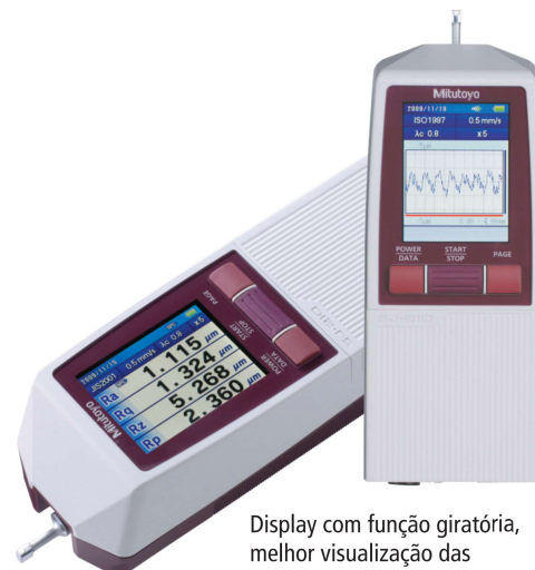
Display com função giratória, melhor visualização das suas medições