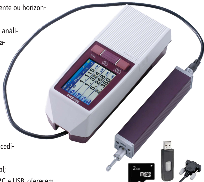
Saídas cartão microSD, USB e RS-232C