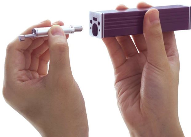
Fácil instalação do sensor